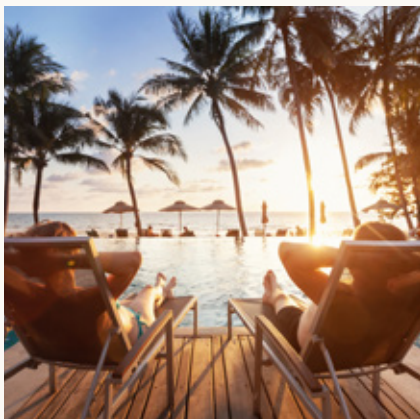
special feature article